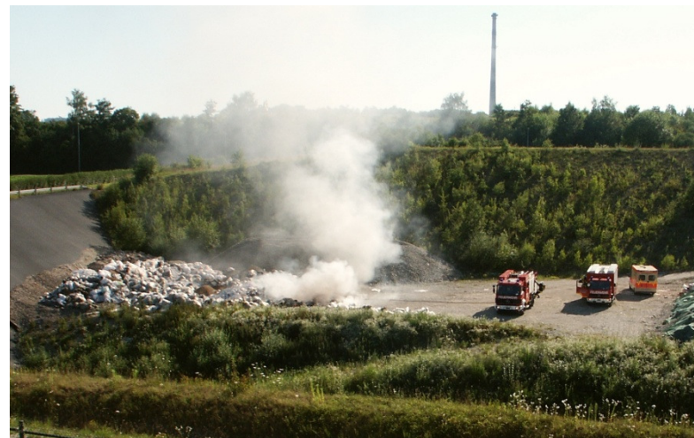
Bild aus der Deponie C Bei der Verbrennung von PVC entsteht Salzsäure und bei der Überhitzung von PFTE bei ca. 360°C entsteht Flusssäure.